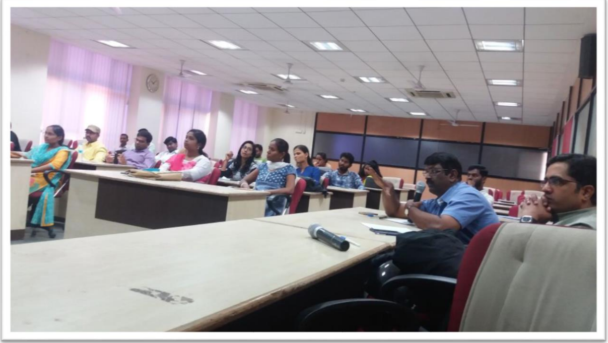
संशोधन विद्यार्थ्यांस तज्ञ व्यक्ती मार्गदर्शन करत असताना स्थिरचित्र