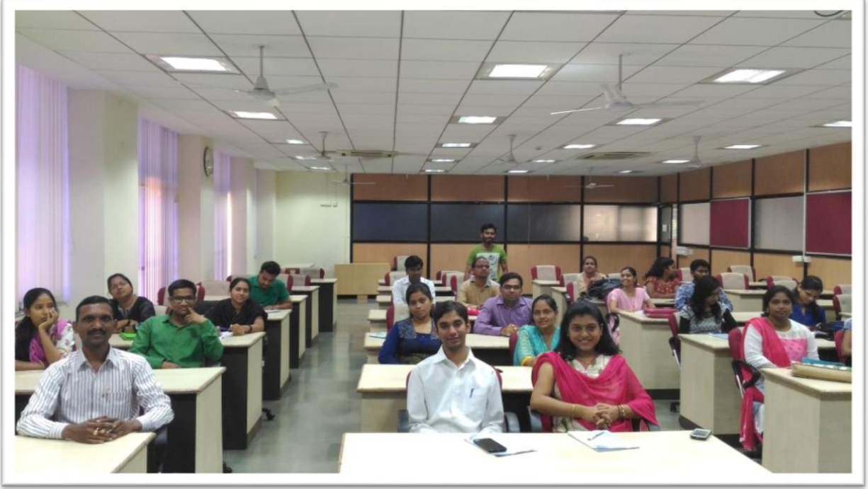
संशोधन विद्यार्थ्यांचे सादरीकरण पाहताना इतर सहभागी विद्यार्थी यांचे स्थिरचित्र