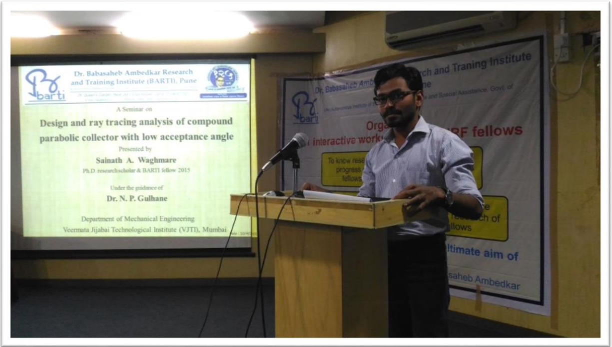
संशोधन विद्यार्थी सादरीकरण करत असताना स्थिरचित्र