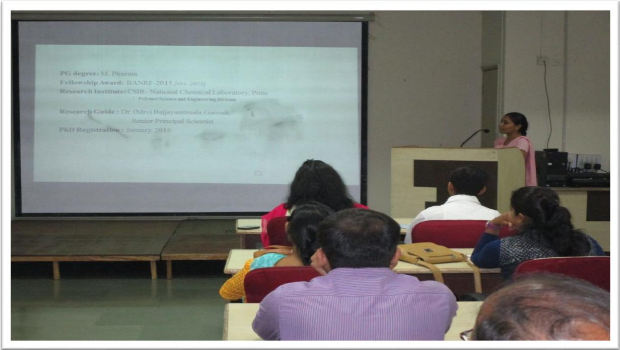
संशोधन विद्यार्थी सादरीकरण करत असताना स्थिरचित्र