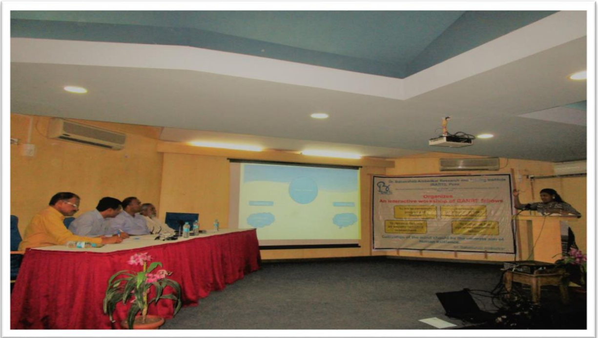
संशोधन विद्यार्थी सादरीकरण करत असताना स्थिरचित्र